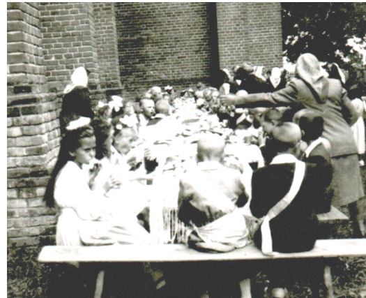
Przyjęcie komunijne w Mokremlipiu Lata 50.