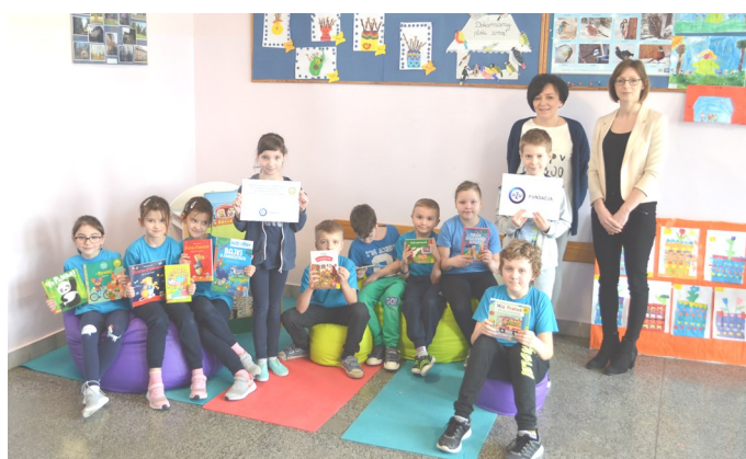
SP w Michalowie