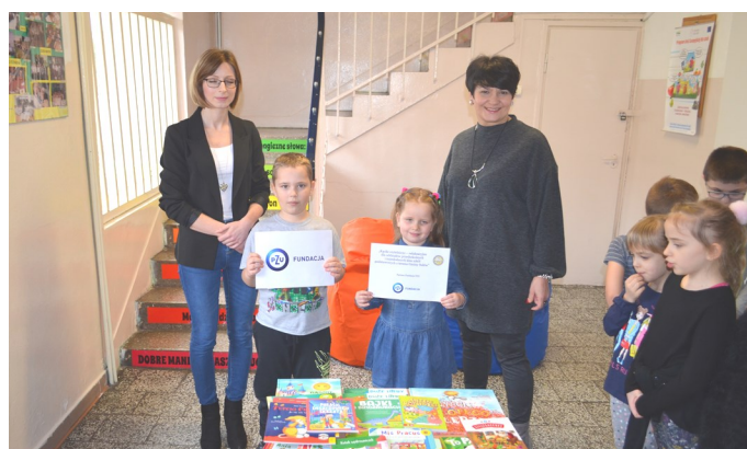
SP w Sułowie