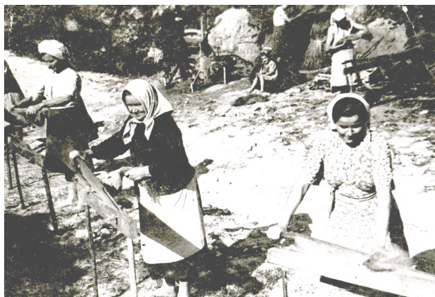
Międłarki - międlenie lnu w drodze przy grodzisku w Sasiadce (lata 60-te XX w.)