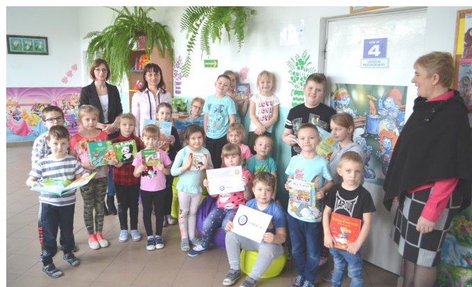
SP w Tworyczowie