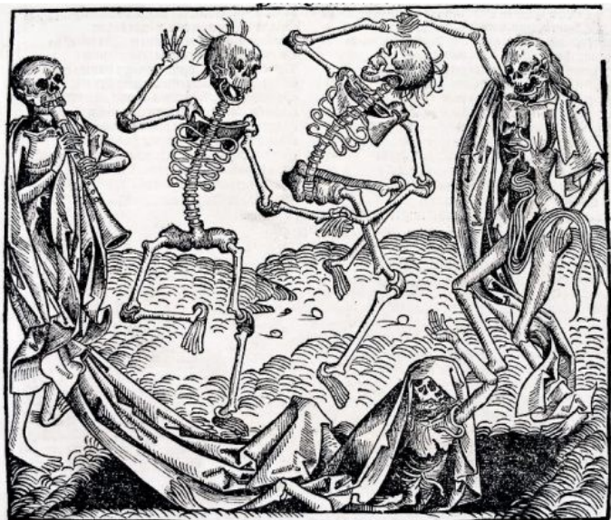
Taniec śmierci Michaela Wolgemuta inspirowany czarną śmiercią

Jej pierwsze ogniska pojawiły się na Krymie, gdzie podczas jednego z oblężeń Mongołowie użyli zarażonych zwłok w roli broni biologicznej. Uciekający z ogarniętej zarazą Kaffy genueńscy kupcy zawlekli następnie zarazę na Sycylię i Półwysep Apeniński, skąd rozprzestrzeniła się po całej Europie. Calej, z wyjątkiem... Polski. Przyczyny choroby nie były znane. Uważano, że do jej